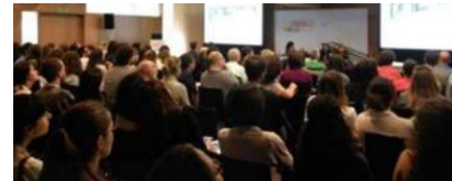
Sesión de casos clínicos Reunión SEPHO Santiago

En nuestro país, la SEPHO cuenta con más de 6 años de recorrido. Es la sociedad científica que engloba la asistencia integral del niño hospitalizado, área específica recogida en el Libro Blanco de las especialidades pediátricas y está reconocida por la Asociación Española de Pediatría. Cuenta con una Reunión Científica integrada en el Congreso AEP con próxima edición en Junio de 2018 en Zaragoza. En anteriores ediciones ha contado con un alto número de asistentes y ha desarrollado actividades teóricas y prácticas de interés para el pediatra hospitalario.