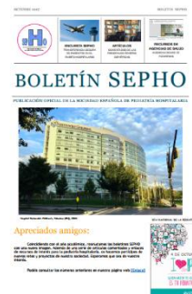
Boletín SEPHO Octubre 2017

Pese al camino recorrido, para consolidar proyectos y desarrollar nuevas líneas de trabajo necesitamos vuestra colaboración . Existen varias formas: